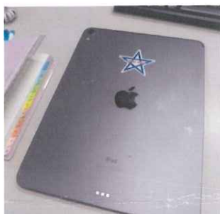
愛用のipad。京都の清明神社で買った電子機器お守りの五芒星のシールを貼ってます。