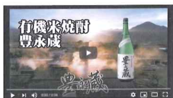
豊永酒造イメージビデオ 2021年1月22日 再生 0 0 0 0 0 0 チャンネル登録 0 コメント 0 共有 0 動画の長さ 動画の長さ

世の中が大きく変化し、我々蔵元も既存のやり方では焼酎を売れなくなってしまいます。ですが、こういう時こそ普段できない新しいことにチャレンジすることが大事ということを実感した1月でした。